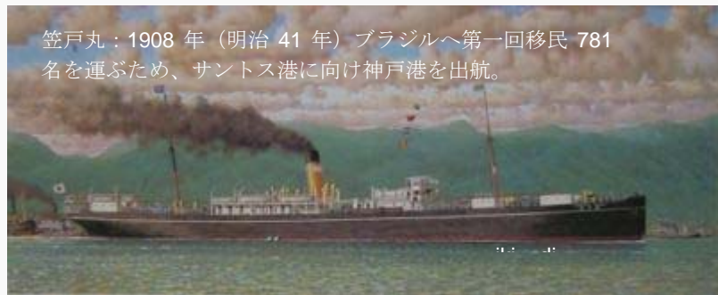
笠戸丸：1908年(明治41年)ブラジルへ第一回移民781名を運ぶため、サントス港に向け神戸港を出航。

その後、渡航先はアメリカやカナダ等の北米、そしてブラジルやペルー、ボリビア、アルゼンチン等の中南米へと移っていきました。また、台湾や南洋群