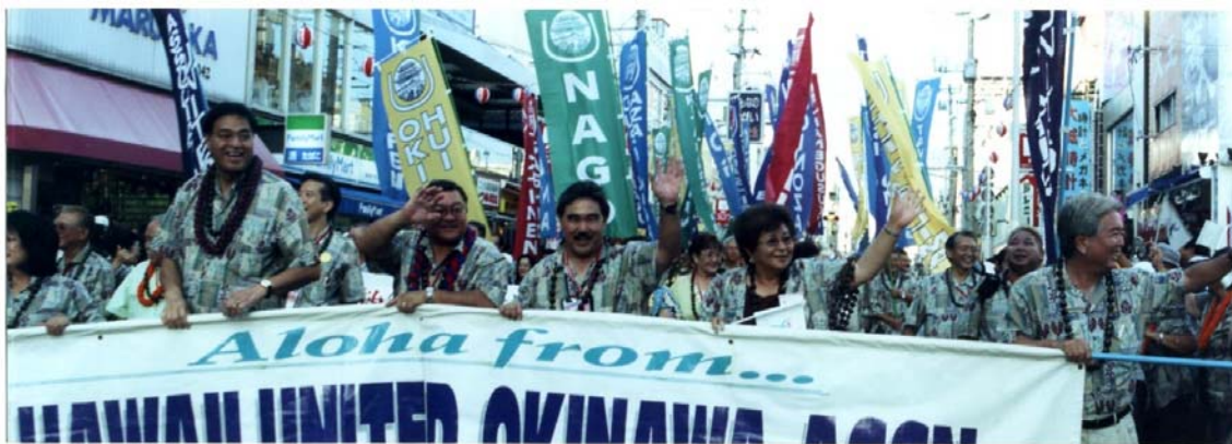
世界のウチナーンチュ大会 沖縄の国際通りをパレード