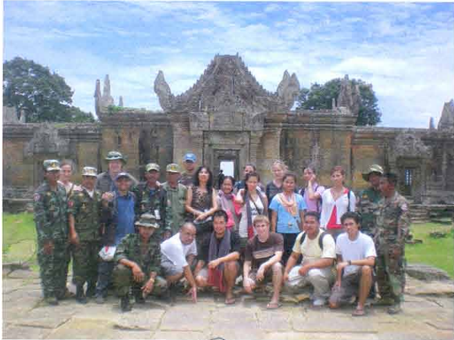
គ្រួសារ ព្រះវិហារ

គ្រួសារព្រះវិហារបានកសាង គោរពស្ថិតិ ១០ ឆ្នាំ ១១ ដោយព្រះមហាក្សត្រខ្មែរ ៤ ឆ្នាំ ហើយឈរ ជាមោទនភាពខ្មែរ ជាតិសេស ក្រោយគ្រួសារព្រះវិហារបានចុះបញ្ជី បេតិកភណ្ឌ ពីភាពខ្សោក គោរពស្ថិតិ ខែកក្កដា ឆ្នាំ ២០០៨ ។ ទោះបីជាទាហានខ្មែរ ចូលទឹកដីខ្មែរក៏ដោយ ក៏ទាហានខ្មែរ ហើយមានមោទនភាព ។