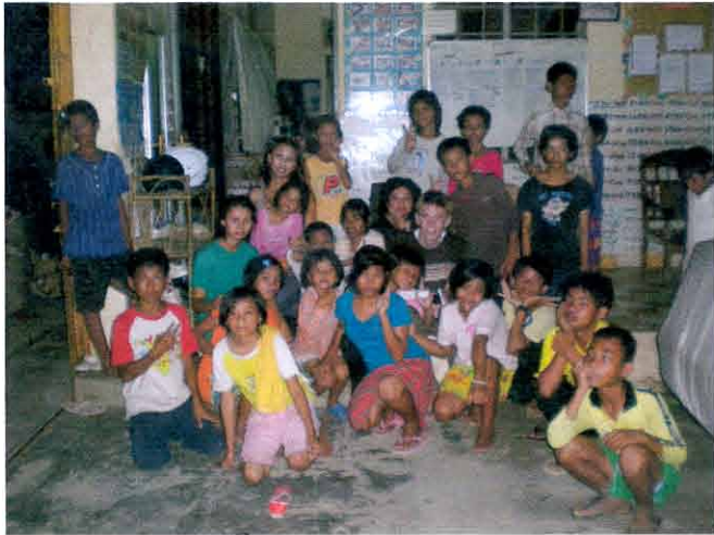
ប្រជាជនខ្មែរ

នៅកំពង់ឆ្នាំង ខ្ញុំបានស្នាក់នៅ ជាមួយគ្រូបង គ្រូស្រីមួយ ដំបូងទាក់ទាក់ គ្រូបងឆាប់ចិត្ត ។ ខ្ញុំ បានសួរ ជាកូនប្រុស របស់គេ ។ គំនូរ ប្រយោជន៍ ប្លុកស្រី ខ្ញុំ ត្រូវបាន បង្រៀន ខ្ញុំ ធ្វើ ម្ហូប ខ្មែរ សើចម្រើន គ្រូបង ហើយបងប្រុសខ្ញុំ បណ្តាញប្រយោជន៍ ម្ហូប ធ្វើម្ហូប ។ ទោះបីជាបានស្រុះស្រួល ក្រុមប្រឹក្សា ជាការស្រុះស្រួល នៅក្នុងប្រទេសខ្មែរ ដូច ជាការស្រុះស្រួល នៅក្នុងប្រទេសខ្មែរ ខ្ញុំ បានស្រុះស្រួល គិត ការស្រុះស្រួល ក្នុងប្រទេសខ្មែរ ។