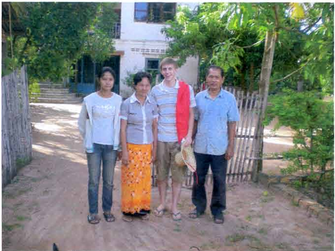
ការស្រុះស្រួល កំពង់ឆ្នាំង

គ្រួសារព្រះវិហារបានកសាង គោរពស្ថិតិ ១០ ឆ្នាំ ១១ ដោយព្រះមហាក្សត្រខ្មែរ ៤ ឆ្នាំ ហើយឈរ ជាមោទនភាពខ្មែរ ជាតិសេស ក្រោយគ្រួសារព្រះវិហារបានចុះបញ្ជី បេតិកភណ្ឌ ពីភាពខ្សោក គោរពស្ថិតិ ខែកក្កដា ឆ្នាំ ២០០៨ ។ ទោះបីជាទាហានខ្មែរ ចូលទឹកដីខ្មែរក៏ដោយ ក៏ទាហានខ្មែរ ហើយមានមោទនភាព ។